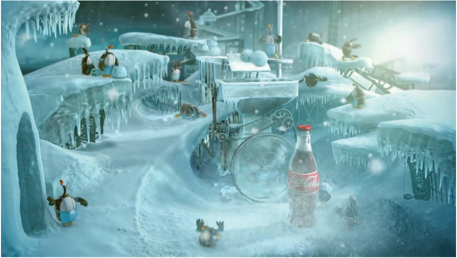
Рис. 4 – Кадр із реклами «Coca-Cola – Happiness Factory»

стає все більш поширеним, хоча все ще вважається дорогим типом анімації. Процес створення такої анімації досить складний і трудомісткий, оскільки вимагає попереднього створення усіх елементів, таких як моделювання та визначення контрольних точок об'єктів, накладення усіх текстур для матеріалів, постановки світла, визначення траєкторій руху та точок для камери. 3D-графіка, на відміну від 2D-графіки, може досить сильно різнитися шляхом реалізації в залежності від обраного програмного забезпечення. Деякі сфери вимагають скоріше технічно-математичного способу задання форм, ближче до урахування властивостей коду. Інші сфери вимагають більш творчого підходу, більш схожого на «виліплення» об'єктів за рахунок відмічення та зміни положення контрольних точок. 3D-анімація нині незамінна, коли не-