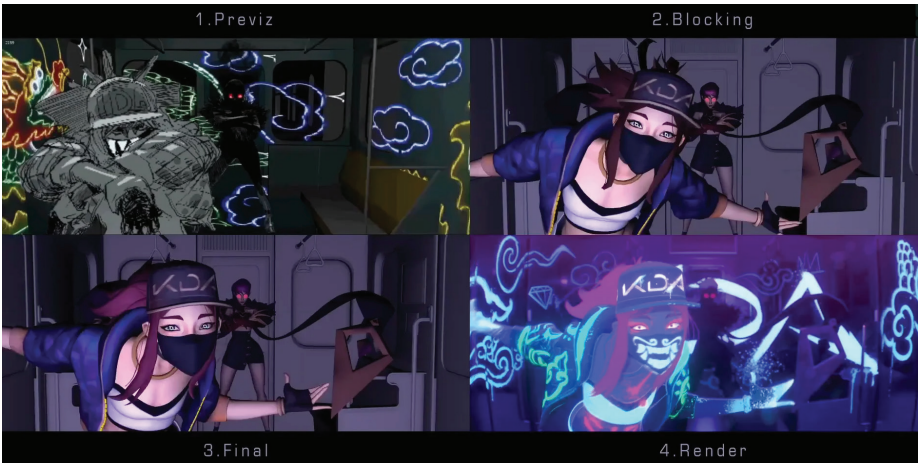
Рис. 2 – Кадр із відео-демонстрації процесу роботи над анімаційним рекламним кліпом «K/DA – POP/STARS»

ри, виразність яких може помітно різнитися в залежності від наявності або відсутності намальованих тіней, світла та інших засобів зображення для простору. Варто відмітити можливості виразності у двовимірній графіці. Навіть дуже гіперболізоване зображення у анімації може бути доречним. Двовимірному герою легше досягти незвичної ходи, використовувати смішну або нереальну міміку, рух об'єктів у просторі може бути зображено більш динамічно, шляхом стрімкої зміни їх масштабу та деталізації зображень. Динамічність рухів у такій рекламі напряму залежить від кількості кадрів на одну секунду відео, оскільки чим більше фаз руху вписано в один проміжок часу, тим плавнішим та достовірнішим буде виглядати сам рух. Ціна створення двовимірної анімації може дуже різнитись, в залежності від складності зображального стилю та кількості кадрів в секунду. Прикладом для такої