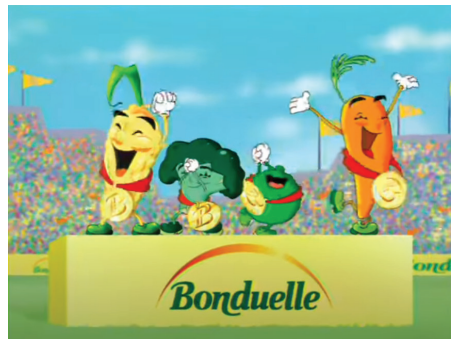
Рис.3 – Кадр із реклами «Bonduelle»

ри, виразність яких може помітно різнитися в залежності від наявності або відсутності намальованих тіней, світла та інших засобів зображення для простору. Варто відмітити можливості виразності у двовимірній графіці. Навіть дуже гіперболізоване зображення у анімації може бути доречним. Двовимірному герою легше досягти незвичної ходи, використовувати смішну або нереальну міміку, рух об'єктів у просторі може бути зображено більш динамічно, шляхом стрімкої зміни їх масштабу та деталізації зображень. Динамічність рухів у такій рекламі напряму залежить від кількості кадрів на одну секунду відео, оскільки чим більше фаз руху вписано в один проміжок часу, тим плавнішим та достовірнішим буде виглядати сам рух. Ціна створення двовимірної анімації може дуже різнитись, в залежності від складності зображального стилю та кількості кадрів в секунду. Прикладом для такої