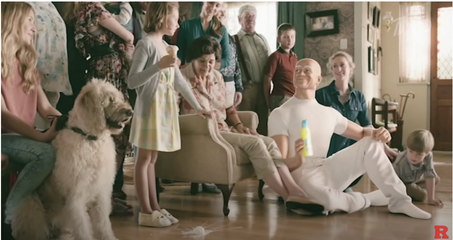
Рис. 5 – Кадр із реклами «Містер Пропер»

поєднання різних завдань, коли не-обхідне одночасне використання комбінації двовимірної або тривимірної анімації зі спеціально знятим відео. Так, наприклад, 2D-персонажі можуть взаємодіяти із з 3D-персонажами, візуально знаходячись у оточенні реальних пейзажів. Нині вже немало технологій поєднання реального зображення із 2D або 3D графікою, серед них варто виділити основні: