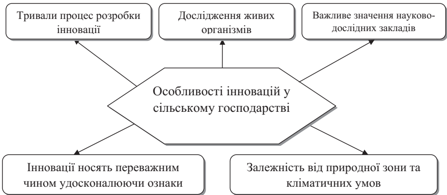
Рис. 1 Особливості інновацій в сільському господарстві

дукції, як правило, не змінюються, тільки набувають покращених властивостей. Слід відзначити, що у сільськогосподарському виробництві розробка інновацій і їх впровадження пов'язані переважно з виведенням нових сортів рослин, порід тварин, виготовленням нової техніки, новими ресурсозберігаючими технологіями, застосування яких у більшості випадків змінює характерні властивості сільськогосподарської продукції, що виробляється, але не призводять до появи нових видів продукції. Це зумовлено, в першу чергу, особливостями самого сільського господарства, а саме основним фактором виробництва виступає земля, взаємодія з живими організмами (рослинами, тваринами, мікроорганізмами), сезонний характер виробництва, високий рівень ризику.